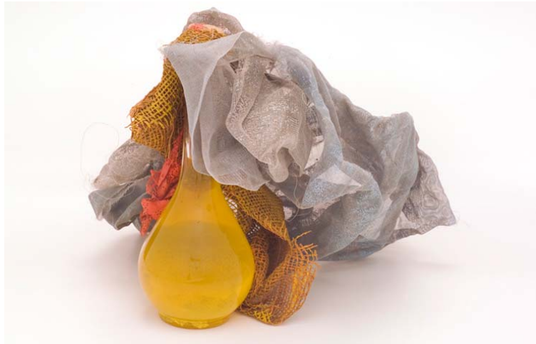
B17 Bólido vidro 5 Homenagem a Mondrian (1965). Vidro, pigmento amarelo suspenso em água, trama de nylon pintada, juta. 31 x 33 x 33 cm.

formadas pelas pinceladas, as cores empregadas sobre os materiais diversos, os pigmentos e a cor. As experiências dos bólides são consequência e superação do quadro, “pintura do espaço” ou a “estrutura-cor”. (OITICICA 1964: 02)