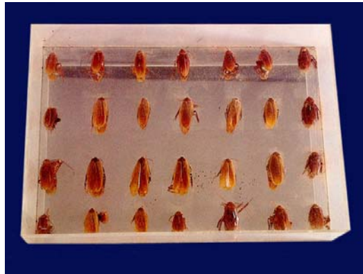
PAPE, Lygia. Caixa de Baratas. Acrílico, baratas e espelho. 35 x 27,5 x 7,5 cm.

espelho traz o sujeito e o espaço exterior para dentro da situação de adversidade construída e utiliza essa própria captação do que está fora para construir a situação de adversidade. Além disso, devolve ao mundo aquilo que é adverso e que retirou dele, criando um duplo movimento de troca, confundindo as fronteiras entre o dentro e o fora.