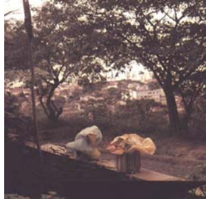
B17 Bólido vidro 5 Homenagem a Mondrian (1965) e B18 Bólido vidro 6 Metamorfose (1965) colocados no jardim da casa do artista.

pigmento, aproximando a terra, o orgânico e o natural ao sintético da cor pura da pintura abstrata.