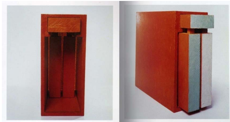
B6 Bólido caixa 6 Egípcio (1963-64). Madeira pintada, 56 x 24 x 57 cm.

Outra dificuldade colocada por Egípcio é a manipulação que propõe. Por tratar-se de uma caixa com objeto deslizante no seu interior, espera-se que o mesmo seja “puxado” com facilidade no ato do manuseio. O bloco de madeira pintado de azul e branco, entretanto, não se move facilmente, apesar de estar apoiado sobre uma placa de vidro colocada no assoalho do interior da caixa. A dificuldade posta no ato da manipulação questiona o espectador sobre o que é esperado da sua participação, criando certo embaralhamento momentâneo, além de sensações desagradáveis de potenciais cortes e quebras que ele pudesse causar à estrutura.