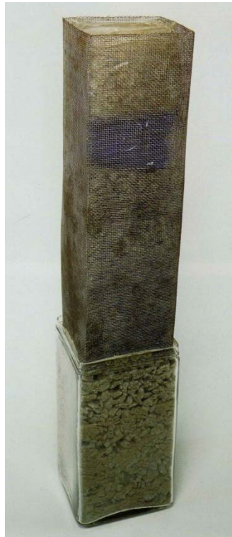
B27 Bólido vidro 13 (1965-66). Vidro, trama de arame, pigmento, conchas, pedras de brita. 95 x 19 x 19 cm.

O conteúdo do bólido fica aparente devido ao uso do vidro e da semi-transparência da trama, pela qual os materiais em parte se revelam, despertando alguma curiosidade de investigação daquele que o observa. Ao partir para o manuseio é que se encontra a restrição. Em primeiro lugar, é difícil porque tanto o plástico recheado de pigmento quanto o de conchas é pesado. Em segundo, os objetos estão praticamente encaixados dentro da torre formada pela trama, de modo que o espaço para o participante colocar as mãos e puxar cada um deles é ínfimo, criando uma barreira para que a participação ocorra. Outra limitação é a própria trama de metal, cuja maleabilidade é pequena, apenas suficiente para que o artista pudesse moldá-la na forma quadrada. É rígida o suficiente para tornar hesitante o manuseio do seu interior, pois dá uma sensação de aspereza capaz de comprometer a integridade física das mãos do participante no caso de um atrito mais forte contra ela. A borda da tela representa um “perigo” ainda maior nesse aspecto, pois apesar de ter sido