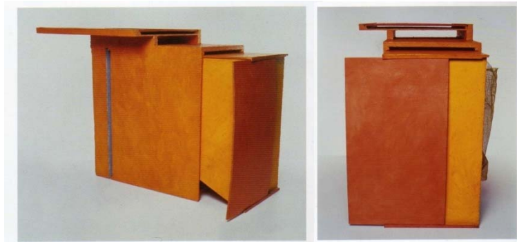
B10 Bólido caixa 8 (1964). Madeira pintada, trama de nylon, 58 x 72 x 40 cm (fechado).