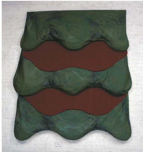
Catunda, Leda. Duas bocas (1994). Tinta acrílica sobre tela e veludo 220 x 340 cm.

Outro artista paulistano, Nuno Ramos, costuma adequar materiais também pouco convencionais nas suas construções. Além de privilegiar substratos que garantem uma fisicalidade imponente (cera, parafina, ferro, mármore, asfalto, somente para citar alguns), Nuno se apodera de verdadeiros abjetos do mundo, pedaços rejeitados, e por vezes forma grandes aglomerados de sobras. É até mesmo possível ver algo dos bólides nessas telas sem título, onde pedaços de sacos plásticos, hastes e tiras de pelúcia convivem em perfeita tensão, aparentemente prestes a desabar da parede, mas fixos na sua solidez matérica.