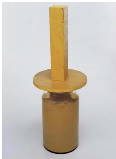
B12 Bólido vidro 3 Em memória de meu pai (1964). Madeira pintada, vidro, pigmento. 75 x 27 cm, diâmetro do vidro: 63 cm, diâmetro da estrutura de madeira: 87 cm.

Esse bólido vidro foi escolhido por parecer antes um totem contemplativo do que um recipiente colocado para manipulação, embora seja esta a sua finalidade. O pote de vidro utilizado na sua composição é alto e estreito, de modo que a abertura superior e porta de entrada para a mão do participante, é, por sua dimensão, um tanto imprópria. Como se não bastasse, Oiticica complica ainda mais a participação e coloca no interior do pote de vidro pigmento amarelo, enterrando nele uma grande peça de madeira pintada também de amarelo, em tom semelhante ao do pigmento. A madeira, como a utilizada nos bólidos caixa, não recebeu tratamento, não foi lixada e é bastante rude. Entretanto, a adversidade colocada pelo objeto aqui não é construída tanto em cima da materialidade palpável, e sim da experiência que o participante faz da matéria.