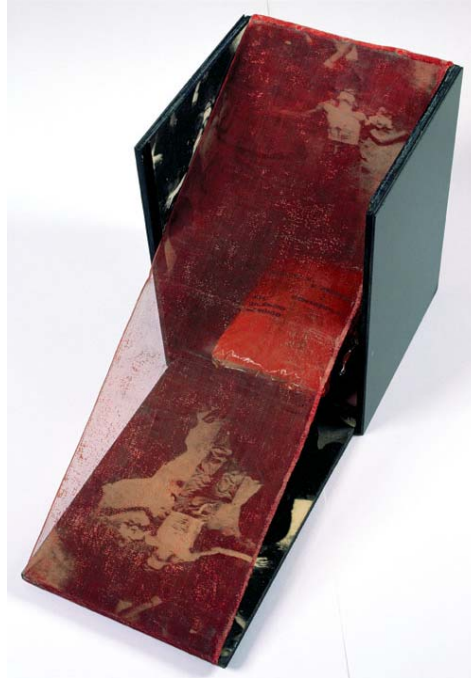
B33 Bólido caixa 18 caixa poema 2 Homenagem a Cara de Cavalo (1965-66). Madeira, fotografia, nylon, acrílico, pigmentos, plásticos. 40 x 30 x 68 cm.

despertado pela presença da fotografia (e a condição de bandido-herói elevada por Oiticica no retrato) associado ao desequilíbrio do saco de pigmento na parte inferior do objeto.