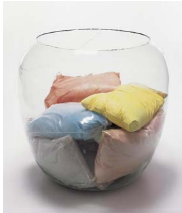
B32 Bólido vidro 15 (1965-66). Vidro, pigmento dentro de sacos de plástico. 46 x 36 cm, circunferência: 152 cm