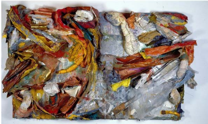
Ramos, Nuno. Sem título (1991). Espelhos, tecidos, folhas, plásticos, tinta, metais, resina sobre madeira. 220 x 340 cm.

Os exemplos acima são de obras que através do informe produzem formas desconfortáveis, mas onde a natureza abjetual não seduz o espectador à manipulação. Tem-se a certeza de que não são obras para tocar, apalpar. O destaque dos bólides nos dias de hoje ocorre pois o atrito entre o convite à investigação com as mãos e sua estranheza material é potencializado quando essa participação é negada. Daí tornam-se ainda mais enigmáticos, quase esquivos para quem os observa.