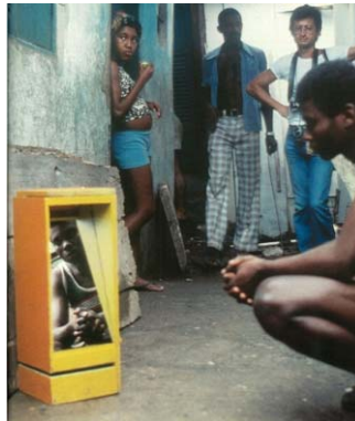
B9 Bólide caixa 7 (1964) refletindo a perna de um morador do morro da Mangueira.

espelho pode inverter a relação de oposição entre interior e exterior com que trabalhamos até aqui. B9 Bólide caixa 7 , é, mais uma vez, uma caixa de madeira pintada em tom forte de amarelo e, como outras analisadas, apresenta uma de suas partes passível de deslizamento, como uma gaveta. O que o diferencia dos demais é o já citado espelho retangular, que reflete o entorno em que o Bólide se encontra. O espelho é capaz de trazer para dentro do objeto o que está do lado de fora, desconstruindo a noção de oposição, se ela for vista como uma via de mão única. O exterior se torna interior, mesmo que momentaneamente, ao mesmo tempo em que aquilo que está de fora continua presente do lado de fora também.