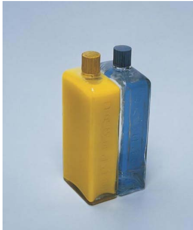
B22 Bólido vidro 10 Homenagem a Malevitch Gemini 1 (1965). Vidros, pigmento suspenso em água, tampas de plástico pintadas. 20 x 08 x 09 cm.